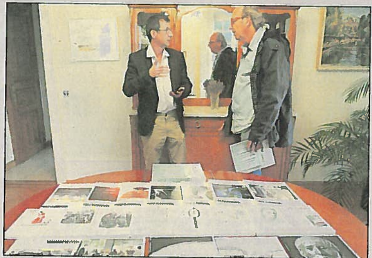
Mémoire Vive fête ses 20 ans ds

de la Ville de Lausanne): «Le Jorat fait figure de forêt urbaine. Ce vingtième numéro de Mémoire Vive présente ce lieu pluriel et toujours source d'enchantement. Un regard plein de fraîcheur où sociologie, his-