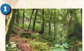
1 Bois du Grand Jorat 46.566649 / 6.736258