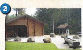
2 Refuge des 4 Croisées 46.5618516 / 6.7590324