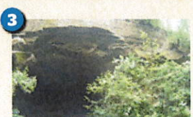
3 Grottes du Pendens 46.580655 / 6.764947