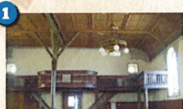
Église de Mézières 46.594914 / 6.771166