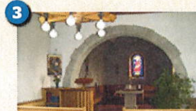
Église de Servion 46.578185 / 6.784902 Date du XIII e siècle, de style gothique primitif.