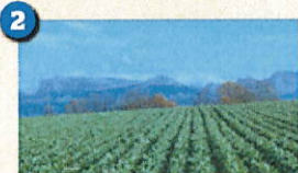
Vue sur les Alpes et Préalpes 46.585878 / 6.783669