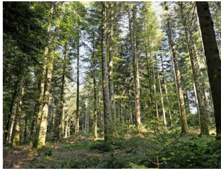
Le fait de posséder une partie du plus grand massif forestier du plateau unit les communes joratoises.

«Ces deux buts conviennent à tout le monde, constate le député-syndic de Froideville, Jean-François Thuillard. J'en causais encore récemment avec des collègues syndics; nous sommes tous d'ac-