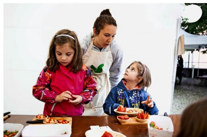
Atelier Ma première tarte aux fruits à l'Espace des p'tits chefs.

Les animateurs sont libres de proposer leur activité, mais «l'originalité, la qualité et les écolos» sont privilégiés. Pour le chef de l'enseigne Tibits, ces démonstrations sont «l'occasion de se faire connaître et de casser les stéréotypes sur la cuisine végétarienne». O.P.